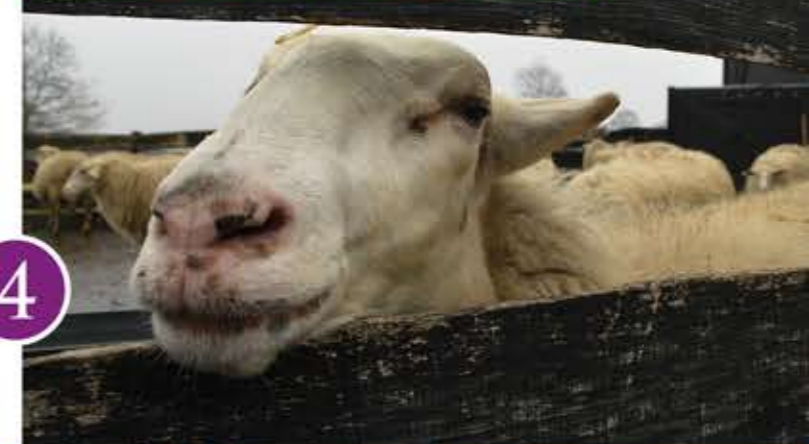
Ermelose schaapskooi en bezoekerscentrum Postweg (=zijweg Drieërweg 130), Ermelo 0577-407254 schapedrift.nl