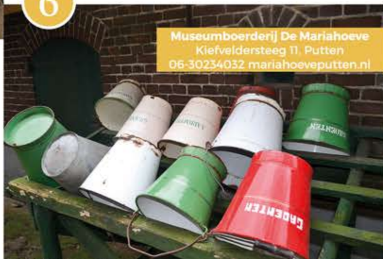
Museumboerderij De Mariahoeve Kiefveldersteeg 11, Putten 06-30234032 mariahoeveputten.nl