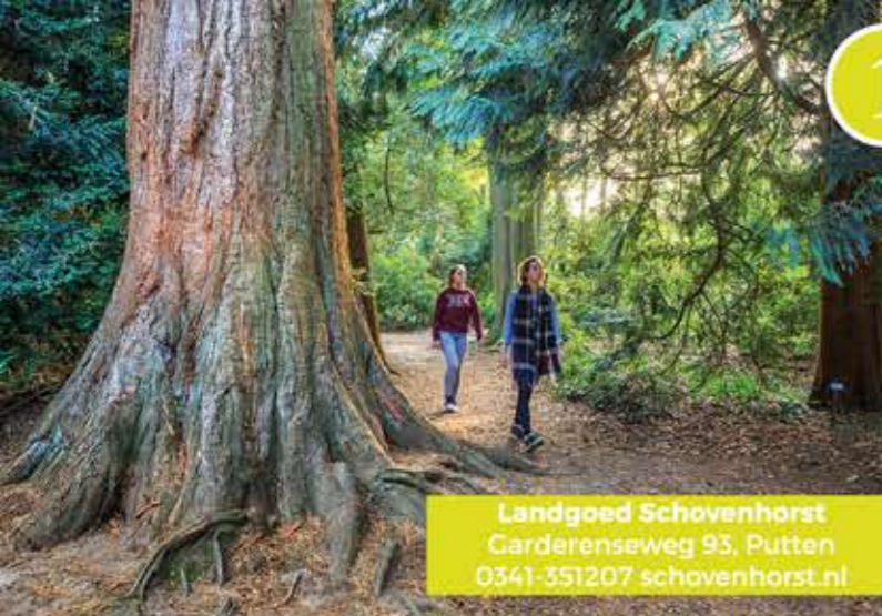
Landgoed Schovenhorst Garderenseweg 93, Putten 0341-351207 schovenhorst.nl