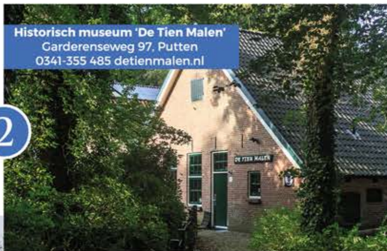
Historisch museum 'De Tien Malen' Garderenseweg 97, Putten 0341-355 485 detienmalen.nl