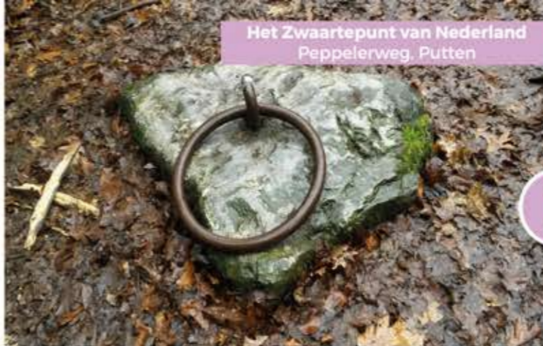
Het Zwaartepunt van Nederland Peppelerweg, Putten

Openingstijden: van april t/m oktober: woensdag t/m zaterdag: 11:00-15:00 uur. In juli en augustus ook op dinsdag open. Van november t/m maart alleen op woensdag en zaterdag open.