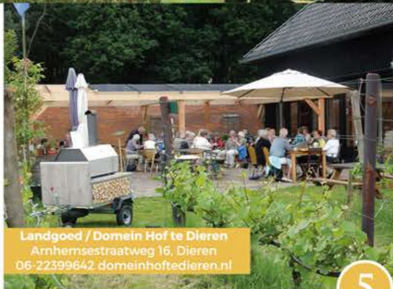
Landgoed / Domein Hof te Dieren Arnhemsestraatweg 16, Dieren 06-22399642 domeinhofte dieren.nl