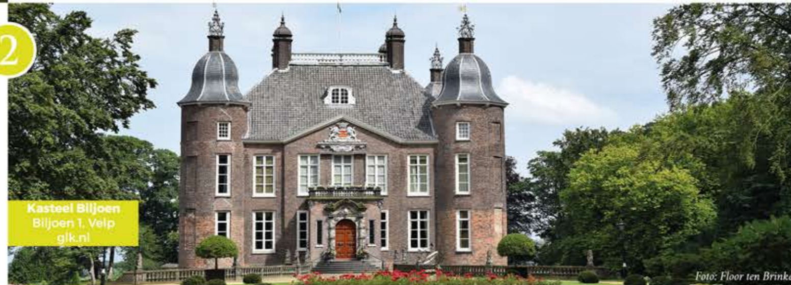
Kasteel Biljoen Biljoen 1, Velp

Kasteel Biljoen voldoet helemaal aan het plaatje van een burcht: vier hoektorens, omringd door een brede slotgracht en slechts toegankelijk via een bruggetje. Het kasteel is gebouwd omstreeks 1530, in opdracht van de hertog van Gelre. In 1661 kocht Alexander van Spaen het landgoed en verfraaide het kasteel. Zo mooi zelfs dat het de Franse zonnekoning, Lodewijk XIV, kon bekoren. Hij verbleef rond 1670 enige tijd in kasteel Biljoen. Het meest imposante vertrek van het kasteel is de Grote Balzaal. De zaal is beroemd in binnen- en buitenland door de indrukwekkende laat 18e-eeuwse decoraties van Giovanni Battista Piranesi. Helaas is het kasteel niet open voor publiek. Geniet daarom vooral van de prachtige buitenkant, in de wetenschap dat binnen muur- en plafondschilderingen te zien zijn met voorstellingen van het Pantheon, de Milvische brug, de piramide van Cestius en de tempel van de Sibylle in Tivoli. Toch leuk om te weten. Het parkbos is wel toegankelijk. Je vindt hier naast prachtige waterpartijen ook een verzameling 18e-eeuwse hekwerken en tuinvazen.