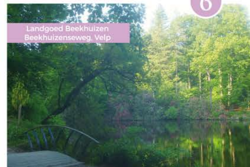
Landgoed Beekhuizen Beekhuizenseweg, Velp

De oudste vermelding van Landgoed Beekhuizen dateert uit 1370. Aan de Beekhuizense Beek lag een bouwland met de bijbehorende boerderijen Groot en Klein Beekhuizen. Eeuwen later, in 1682, kocht Alexander van Spaen, ook eigenaar van kasteel Biljoen, landgoed Beekhuizen. De landschapsarchitect J.D. Zocher jr., ook verantwoordelijk voor de tuin rond kasteel Rosendael, legde een voor die tijd trendsetend romantisch park aan. Kronkelende beekjes, vijvers met bruggetjes en rotspartijen met watervallen, omgeven door prachtige bloeiende rododendrons. In de 19e eeuw werd langs de Beekhuizensebeek een prachtig hotel in Zwitserse chaletstijl gebouwd. Helaas brandde dit pand in 1980 af. Je kunt prachtig wandelen in het parkbos van Beekhuizen. Geniet van beekjes met bruggetjes en loop ook even naar de vijver met rododendrons.