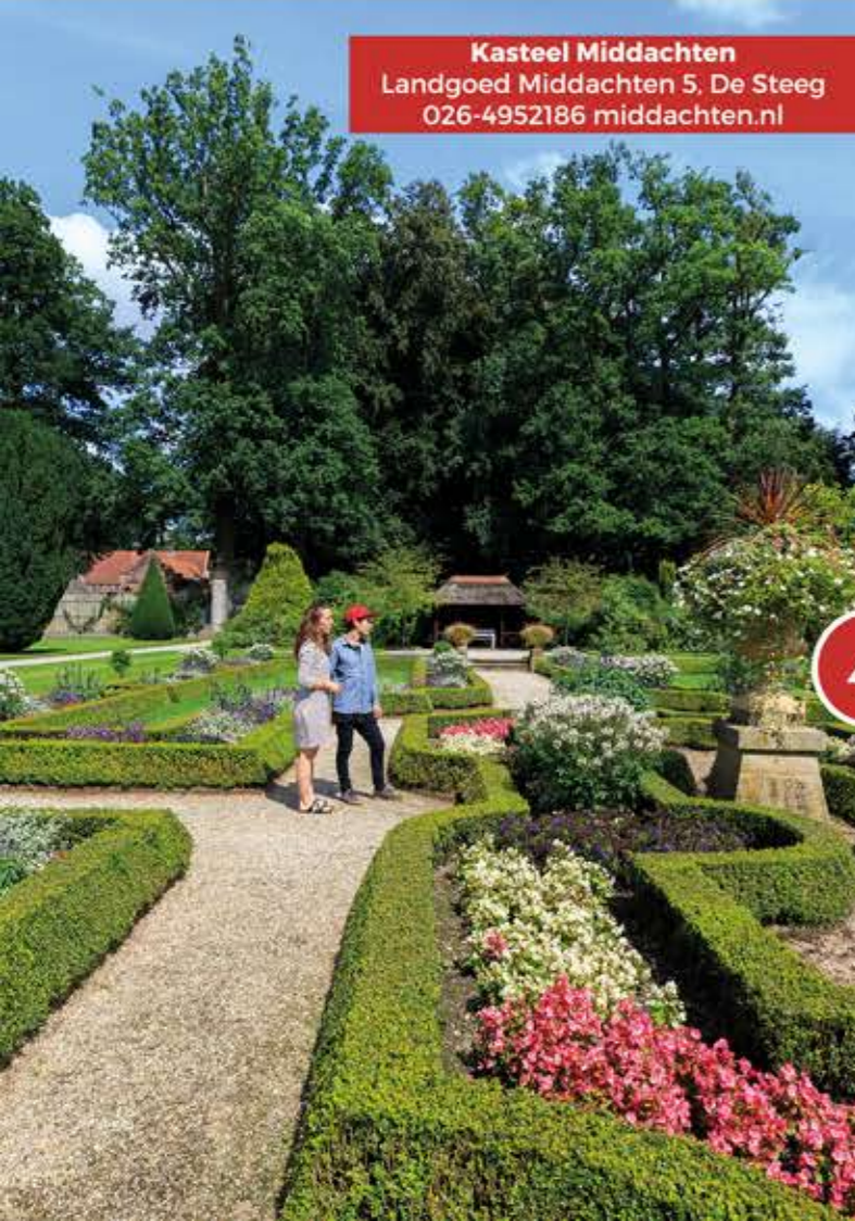
Kasteel Middachten Landgoed Middachten 5, De Steeg 026-4952186 middachten.nl