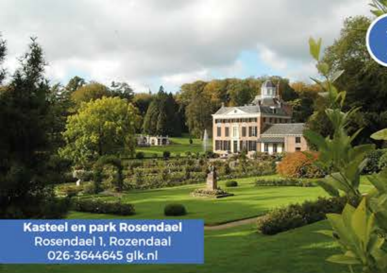
Kasteel en park Rosendael Rosendael 1, Rozendaal 026-3644645 glk.nl